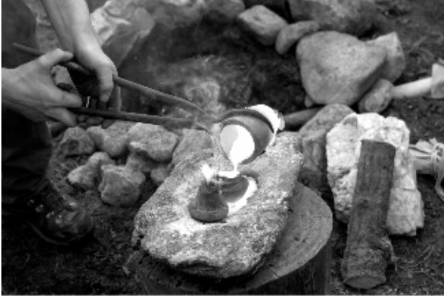
Demostración de las técnicas empleadas en el pasado para el trabajo del metal.

Los principales aportes que se produjeron en la edad de los metales son: