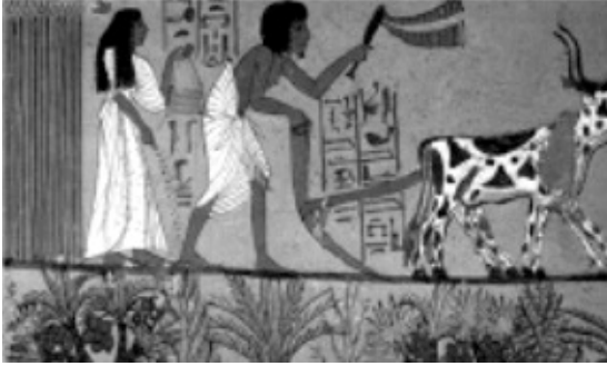
Escena agrícola de labranza. Tumba de Sennedjem